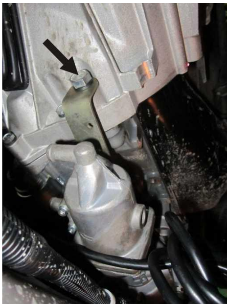
Рис. 2. Установка подогревателя. Вид снизу.