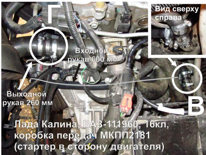
Рис. 3. Врезка тройников на Калину. Вид сверху, со стороны левого переднего колеса