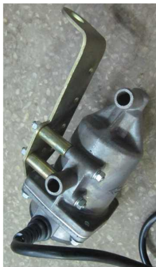
Рис. 1. Крепление кронштейна.